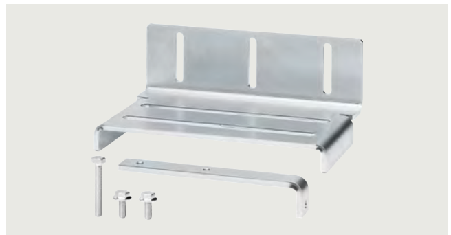
Montagewinkel SIDOOR gross