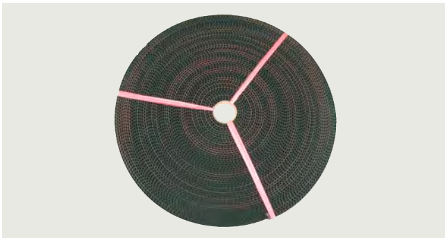
Zahnriemen 6FB1104-0AT02-0AB0 Länge 45 m