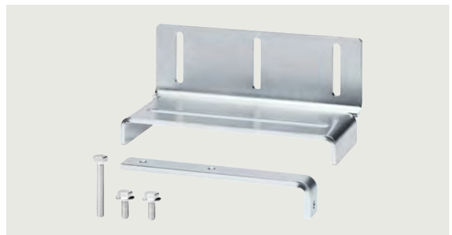
Montagewinkel SIDOOR klein